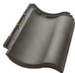
Антрацит матовый ангоб