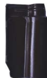
Glazed Amarante brown