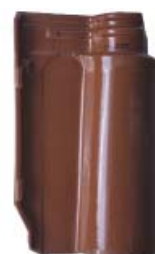
Glazed natural red