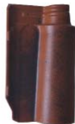
Aged Lamego Red