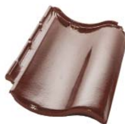
Марон высококачественный ангоб