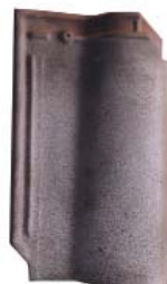
Antica San Quirico