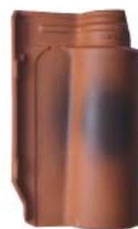
Flamed Natural Red