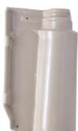
Glazed Molenos White