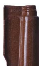
Glazed Mesclado Conimbriga