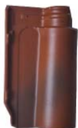
Flamed Lamego red