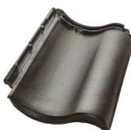
Алмазно-черный высококачественный ангоб