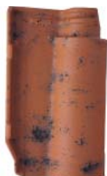
Aged natural red