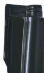
Glazed Geres Green