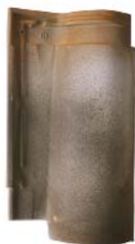
Antica San Quirico