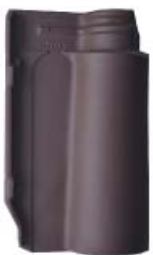
Natural Sepia Brown